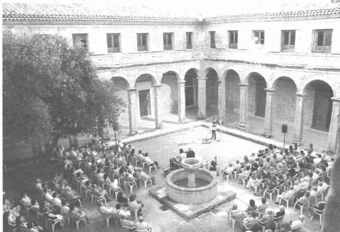
El concierto tuvo lugar en el claustro del antiguo convento de Jesús y María, más conocido como "El Cristo"

Julián Elvira toca con su flauta complex, basada en la teoría complex de Istvan Matuz, instrumento único de producción propia, siendo ésta el último paso en la evolución de la flauta travesera